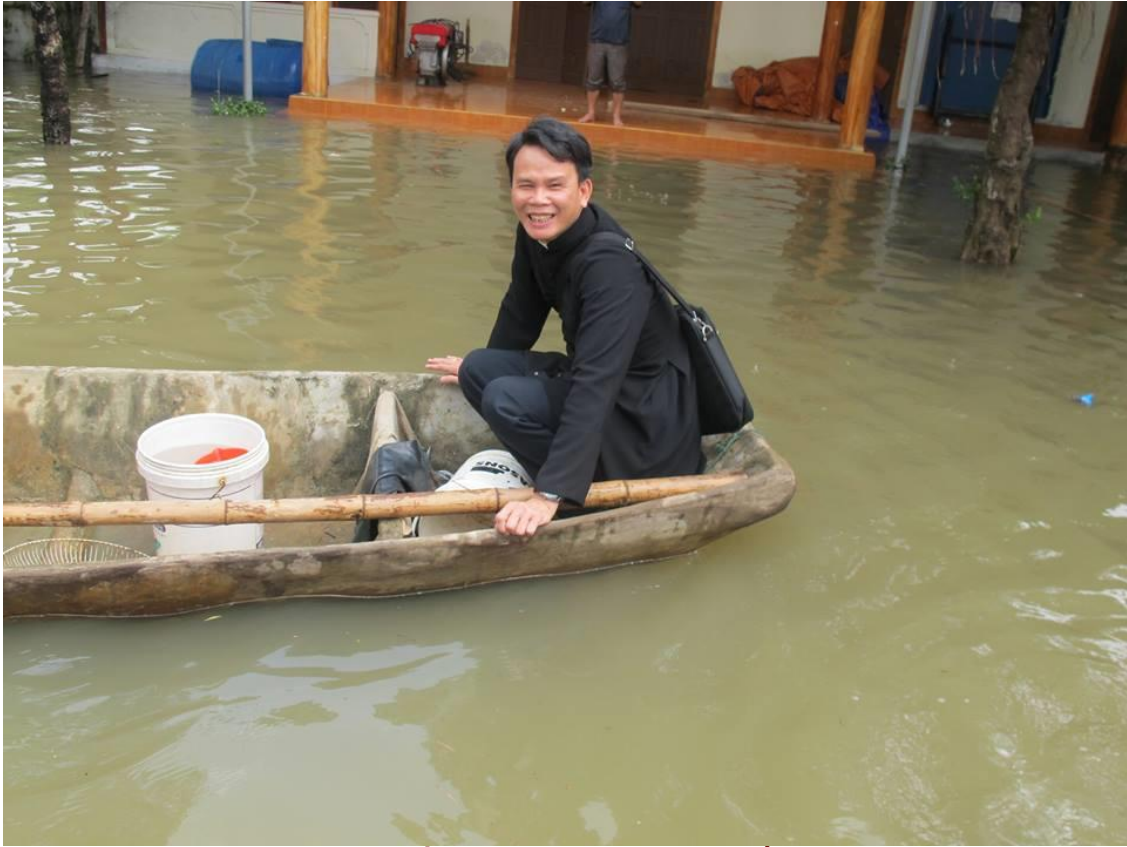
Cha GB Nga Đi Dâng Lễ Về Mùa Mưa Lụt Ngập Úng