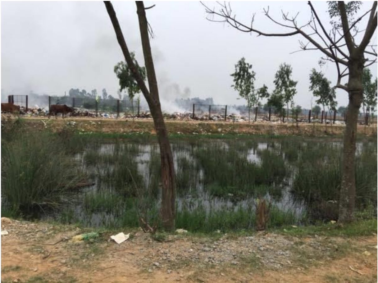
Ô Nhiễm Môi Trường Sống Đã Đến Mức Thảm Họa Ở Xứ Đạo Tân Sơn

Lại còn đang phải gánh chịu thêm sự ô nhiễm môi trường sống: