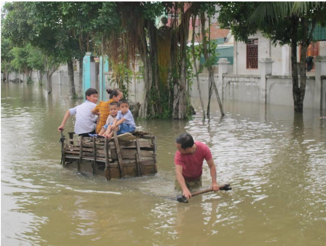
Sinh Hoạt Của Các Gia Đình Về Mùa Mưa Lụt Ngập Úng